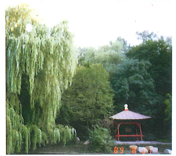
▲1989年 9月ドイツのベルリンに設置された平和の鐘

世界各国の首都に設置される「世界平和の鐘」の実物は、土台約5m四方、高さ約4.7m、鐘の高さ1.05m、鐘の直径60cm、鐘の重量365kgです。