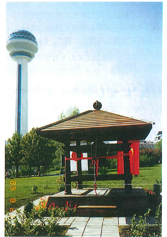
▲1989年 9月トルコ首都アンカラに設置された平和の鐘

このレプリカは、世界101ヶ国から提供を受けたコインやメダルで铸造され、世界各国に設置される「世界平和の鐘」の実物の1/15のレプリカです。当会では、このレプリカをINF全廃条約を記念して前レーガン大統領、元ゴルバチョフ大統領、ブッシュ大統領、又東西ドイツ統一を記念してコール首相に贈呈いたし、各国元首からお礼状を頂きました。又、国連事務総長ブアトロス・ガリー総長にも贈呈いたしました。