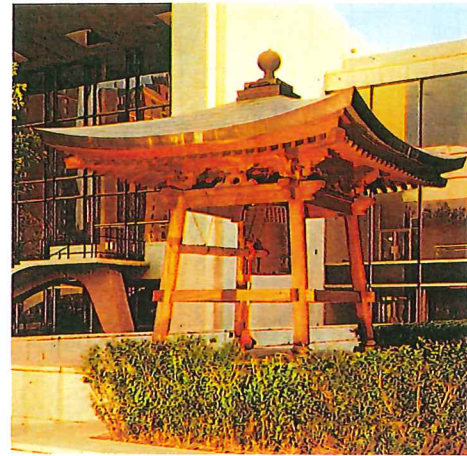
ニューヨーク国連本部に設置されている平和の鐘

国連本部に設置されている「鐘」は、国連総会開会時に、国連事務総長が世界平和を祈願して鐘打している「鐘」です。