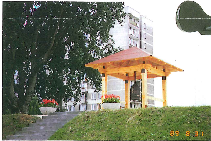
▲1989年 9月ポーランド首都ワルシャワに設置された平和の鐘