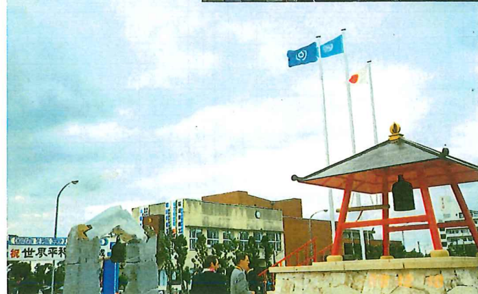
1988年12月日本最南端沖縄県石垣市平和公園に設置されている平和の鐘